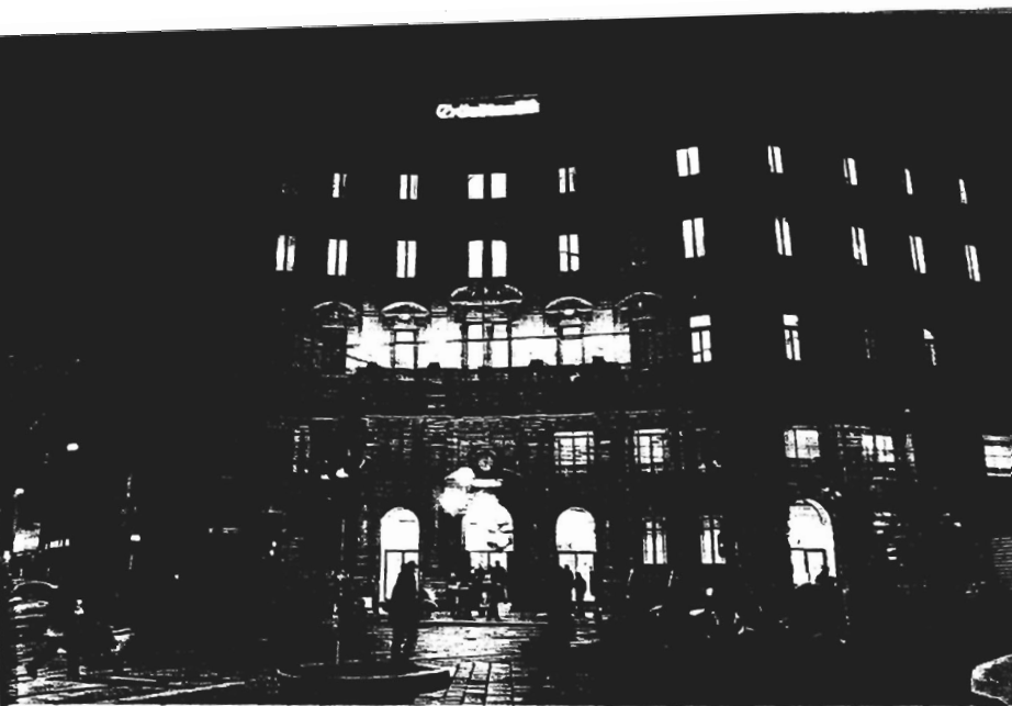
UNICREDIT IN PIAZZA CORDUSIO A MILANO