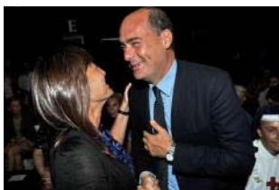
AMORE TRA POLVERINI E ZINGARETTI