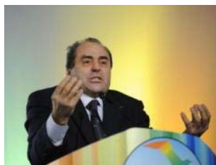
ANTONIO DI PIETRO IDV