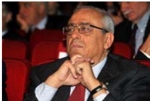
FRANCESCO GAETANO CALTAGIRONE

nella quale la sua quota è salita ieri al 13,1% sopravanzando i francesi di Gaz de France.